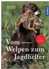
Hans-Jürgen Markmann Vom Welpen zum Jagdhelfer 240 S., 329 Abb., geb. € 36,-