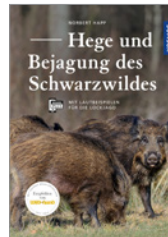
Norbert Happ Hege und Bejagung des Schwarzwildes 224 S., 179 Abb., geb. € 32,-