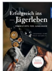
Seibt/Deilbach Erfolgreich ins Jägerleben 144 S., 141 Abb., geb. € 24,99