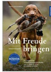
Tanja Dautzenberg Mit Freude bringen 144 S., 224 Abb., brosch. € 24,-