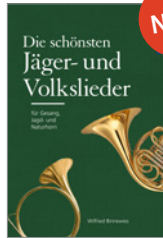
Wilfried Binnewies Die schönsten Jäger- und Volkslieder 152 S., brosch. € 15,-