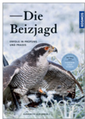
Elisabeth Leis (Hrsg.) Die Beizjagd 208 S., 205 Abb., geb. € 32,-