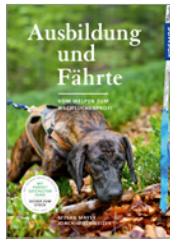
Mayer/Schweizer Ausbildung und Fährte 160 S., 130 Abb., geb. € 25,-