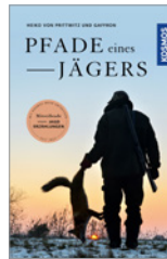
Heiko von Prittwitz und Gaffon Pfade eines Jägers 224 S., geb. € 25,-