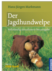
Hans-Jürgen Markmann Der Jagdhundwelpen 160 S., 137 Abb., geb. € 26,-