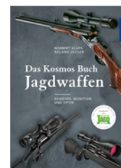
Klups/Zeitler Das Kosmos Buch Jagdwaffen 272 S., 396 Abb., geb. € 39,90