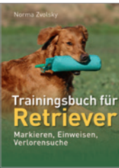
Norma Zvolosky Trainingsbuch für Retriever 144 S., 173 Abb., brosch. mit Spiralbindung € 18,-