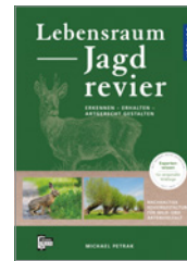
Michael Petrak Lebensraum Jagdrevier 240 S., 200 Abb., geb. € 39,-