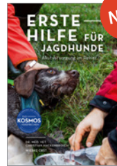
Hackenbroich/Obst Erste Hilfe beim Jagdhund 144 S., 160 Abb., geb. € 28,-