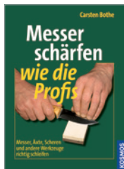
Carsten Bothe Messer schärfen wie die Profis 100 S., 142 Abb., geb. € 14,-