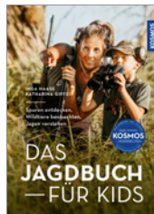
Haase/Giffei Das Jagdbuch für Kids 128 S., 110 Abb., brosch. € 18,-