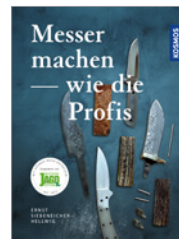
Ernst G. Siebeneicher-Hellwig Messer machen wie die Profis 136 S., 220 Abb., geb. € 22,-