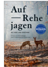
Dr. Konstantin Börner Auf Rehe jagen 160 S., 162 Abb., geb. € 28,-