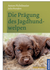
Fichtlmeier/Numben Die Prägung des Jagdhundwelpen 128 S., ca. 100 Abb., geb. € 24,-