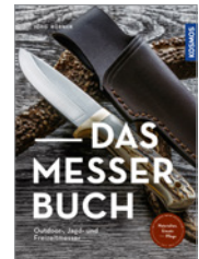
Jörg Hübner Das Messerbuch 144 S., 200 Abb., brosch. € 25,-