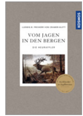
Ludwig Benedikt Freiherr von Cramer-Klett Vom Jagen in den Bergen 320 S., 2 Abb., geb. € 28,-