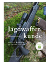
Norbert Klups Jagdwaffenkunde 144 S., 150 Abb., geb. € 30,-