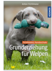
Anton Fichtlmeier Grunderziehung für Welpen 240 S., 200 Abb., geb. € 26,-