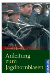
Heinrich Jacob Anleitung zum Jagdhornblasen 40 S., brosch. € 8,-