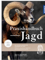
Bachmann/Roosen Praxishandbuch Jagd 656 S., 1.021 Abb., geb. € 68,-