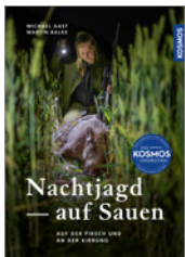
Gast/Balke Nachtjagd auf Sauen 144 S., 160 Abb., brosch. € 24,-