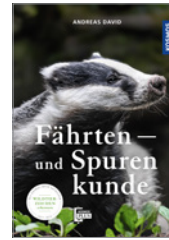
Andreas David Fährten- und Spurekunde 160 S., 152 Abb., brosch. € 20,-