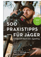
von Harling/Bothe 500 Praxistipps für Jäger 192 S., 250 Abb., brosch. € 22,-