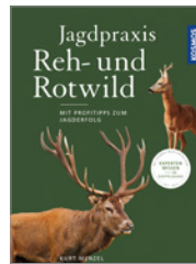
Kurt Menzel Jagdpraxis Reh- und Rotwild 336 S., 194 Abb., geb. € 26,-