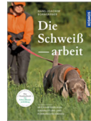
Hans-Joachim Borngräber Die Schweißarbeit 336 S., 368 Abb., geb. € 50,-