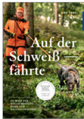
Uwe Tabel Auf der Schweißfährte 144 S., 104 Abb., geb. € 28,-