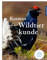
Ekkehard Ophoven Kosmos Wildtierkunde 192 S., 240 Abb., brosch. € 22,-