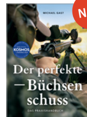
Michael Gast Der perfekte Büchsen schuss 160 S., 110 Abb., geb. € 28,-