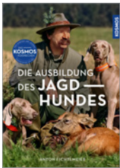
Anton Fichtlmeier Die Ausbildung des Jagdhundes 256 S., 300 Abb., geb. € 36,-