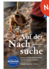
Frank Rakow Nachsuche 144 S., geb. € 24,-