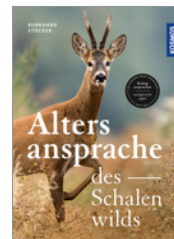
Burkhard Stöcker Die Altersansprache des Schalenwilds 160 S., 190 Abb., geb. € 28,-