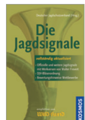
Deut. Jagdschutzverband Die Jagdsignale 48 S., brosch. € 8,-