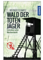
Werner Schmitz Wald der Toten Jäger 256 S., brosch. € 16,99