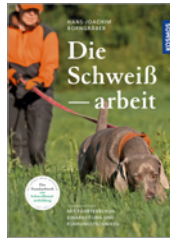
Hans-Joachim Borngräber Die Schweißarbeit 336 S., 368 Abb., geb. € 50,-