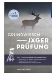
Siegfried Seibt Grundwissen Jägerprüfung 608 S., 857 Abb., geb. € 34,-