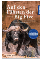
Rolf D. Baldus Auf den Fährten der Big Five 326 S., 138 Abb., geb. € 34,-