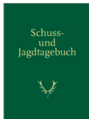
Schuss- und Jagdtagebuch 128 S., 32 Abb., geb. € 18,-