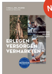
Isabelle Bulling Erlegen - versorgen - vermarkten 160 S., 105 Abb., geb. € 30,-