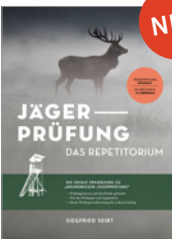
Siegfried Seibt Jägerprüfung - das Repetitorium 160 S., 50 Abb., brosch. € 22,-