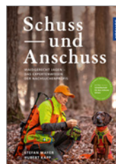
Kapp/Mayer Schuss und Anschuss 176 S., 238 Abb., geb. € 32,-