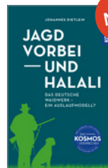
Johannes Dietlein Jagd vorbei und Halali 304 S., ca. 25 Abb., geb. € 28,-