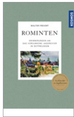
Walter Frevert Rominten 352 S., 20 Abb., geb. € 28,-